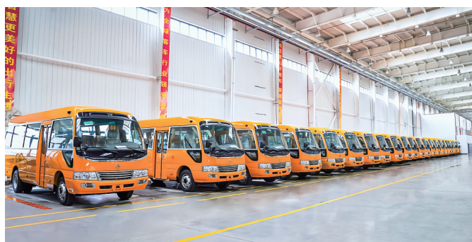
金旅客车的考斯特校车已发往阿曼。

亮眼。今年前两个月,金旅客车以2074辆的出口总销量、同比大增235.06%、市场份额23.55%的成绩继续保持行业第一,市场表现强劲。厦门金龙以1278辆的出口总销量、同比增长41.84%、市场份额14.51%排名第二。