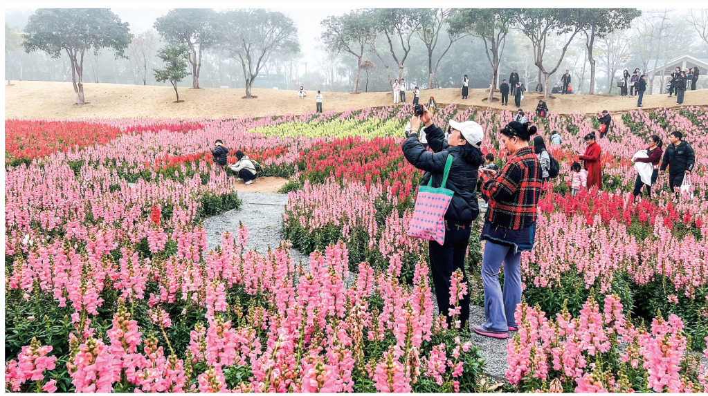
植物园狮山园金鱼草花海。