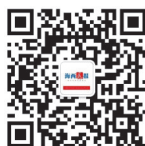
海西晨报官方微信

关注“海西晨报”微信公众号,将拆解详细步骤发送到后台,注明“棋局竞猜”,并附上姓名和联系方式。