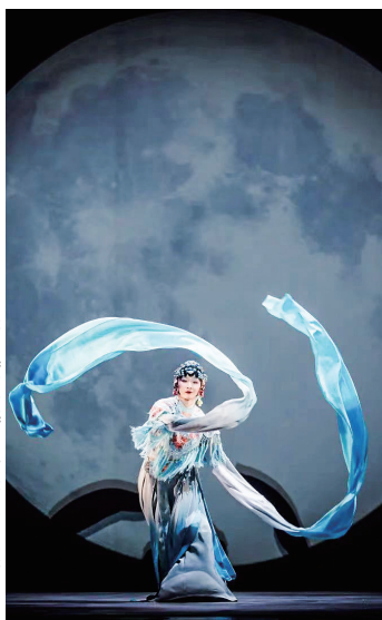
舞剧《青衣》8年来演出近百场。

此外,2月7日(大年初十),由知名音乐家王滔、苏贞、张放所组成的“京彩三重奏”将带来精彩表演。他们将为厦门观众演绎巴赫、贝多芬、勃拉姆斯的作品,展现单簧管、中提琴与钢琴合奏的独特魅力。