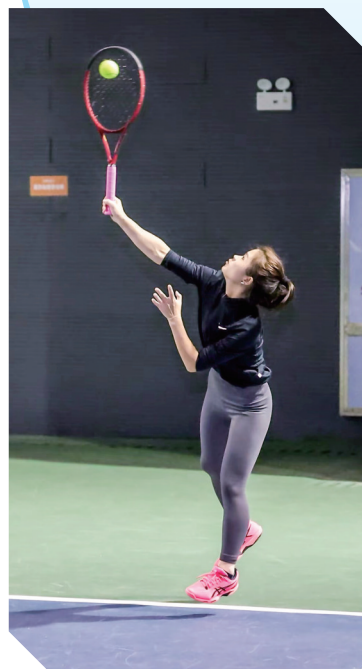
厦门市机关三小球比赛掀起运动热潮。(往届资料图)

本届赛事由厦门市体育局、中共厦门市委市直机关工作委员会、厦门市总工会主办,海西晨报社、厦门市乒乓球协会、厦门市羽毛球协会、厦门市网球协会承办。