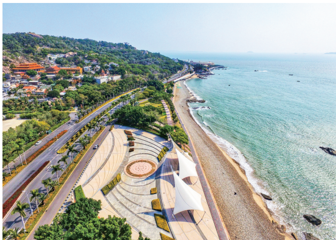
厦门高质量发展文旅经济拥有众多得天独厚的优势。

大会现场还展播了厦门旅游发展成果。近年来,厦门市委市政府将推动旅游高质量发展作为