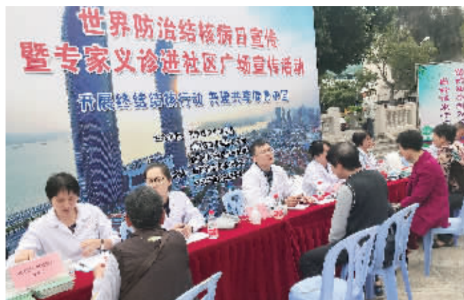
专家进社区开展义诊活动,为广大患者送去贴心服务。

促进”系列宣传活动。红十字、爱国卫生、健康教育宣传、家庭医生签约、计生协儿童早期发展、青春健康知识宣传、