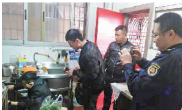
检查人员对8处宗教场所的瓶装燃气安全隐患进行集中整治。

晨报讯(通讯员 张婧妮)为进一步加强瓶装燃气安全工作,切实保障居民用气安全,3月7日上午,区燃气管理中心联合区民族与宗教事务局、厦港街道、社区等各燃气职能部门对街道辖内8处宗教场所的瓶装燃气安全隐患进行集中整治。