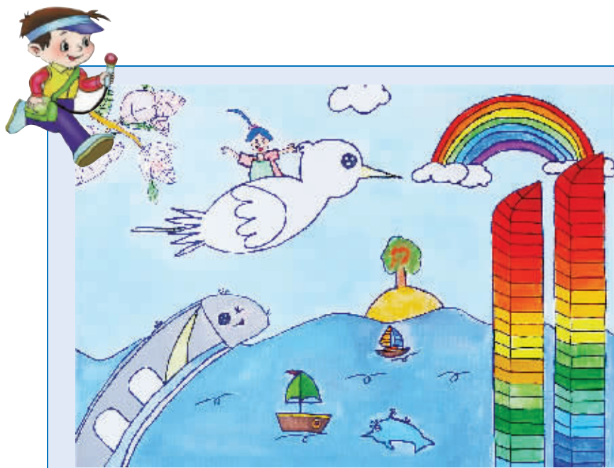
《欢迎你来到沙坡尾》