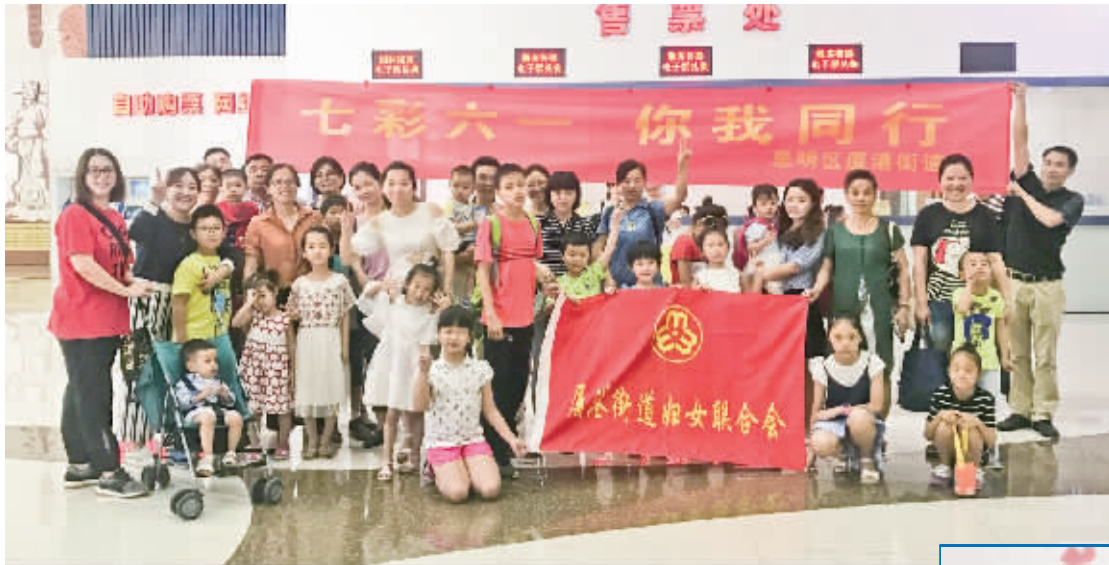
家长儿童共游科技馆。

为了庆祝“六一”国际儿童节,自5月下旬开始,厦港街道开展了一系列庆“六一”活动,让孩子们有学有玩有欢乐,家长们加强亲子教育,促进亲子关系。同时,街道还组织了慰问贫困儿童活动,用爱心温暖他们的心灵。