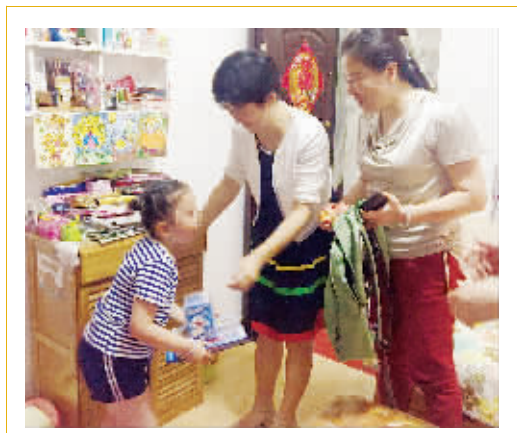
为困难家庭儿童赠送节日礼物。

在科技馆大厅,一面巨大的水钟吸引了小朋友们的注意,只见蓝色液体在透明的玻璃容器中“翻山越岭”,最终触动钟表指针拨动。小朋友用手指着告示板上的文字说明,逐字认真地阅读。科技馆中丰富的特色科学项目,让小朋友们高兴得手舞足蹈,有的家长也忍不住和孩子一起玩耍。