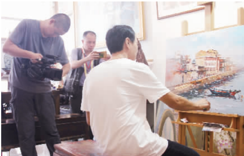
记者们被以老厦港为题材创作的油画吸引。 P179040762