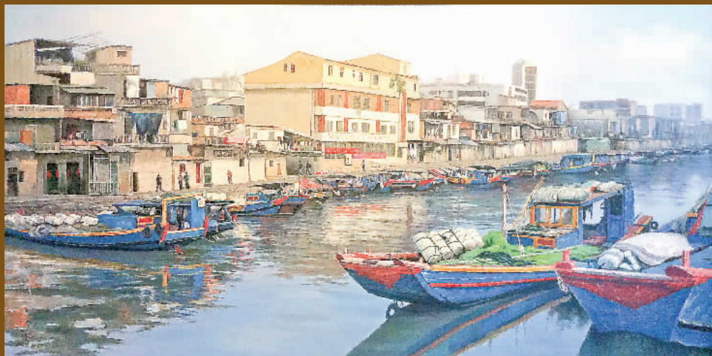
蔡天安的作品《沙坡尾系列之2013》，画幅长2.3米、宽1.3米。